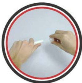
Надеть пластиковую гильзу