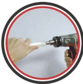
Вставить инструмент и расширить трубу вместе с гильзой